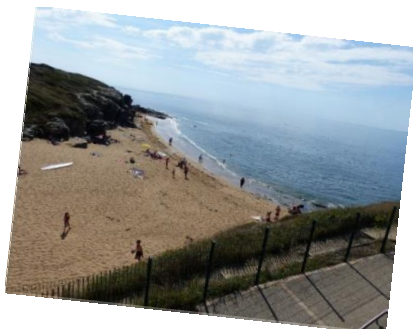
Vue de la terrasse