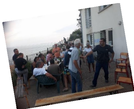
Après l'effort ...