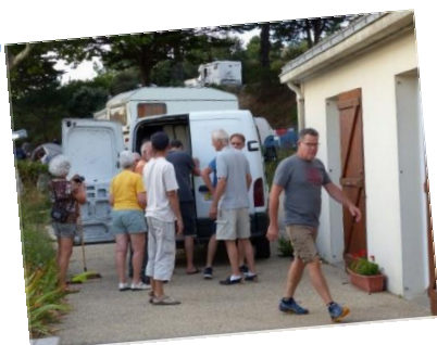
Au boulot !