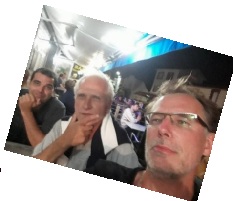
Le trio de déménageurs en pleine réflexion